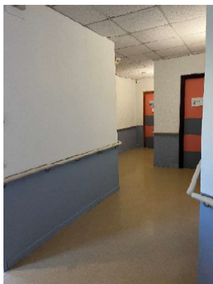
Couloir d'accès aux studios