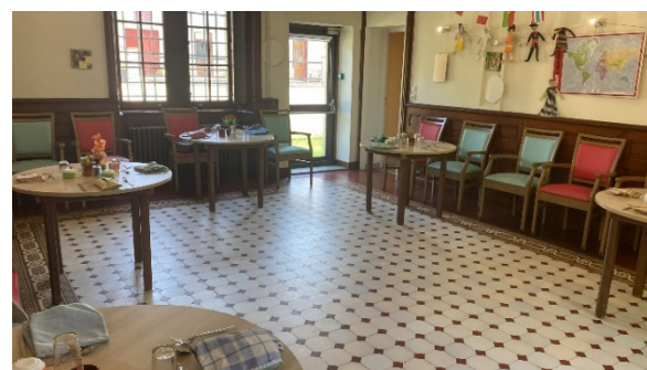
Salle à manger.