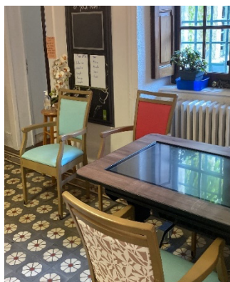
Petit Salon et table interactive

Tout comme le cadre extérieur, les locaux communs à l'intérieur sont agréables et accueillants, et tout est fait pour faciliter le déplacement des résidents, comme des chaises adaptées aux personnes âgées ou des fauteuils électriques pour se lever plus facilement, ou bien des rampes permettant une préhension aisée.