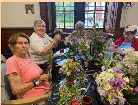
Décorations pour le 15 août

Maintenir son autonomie, c'est aussi participer à la décoration des locaux ; aidés par les bénévoles et les personnels, les résidents ont à cœur de décorer leur lieu de vie.